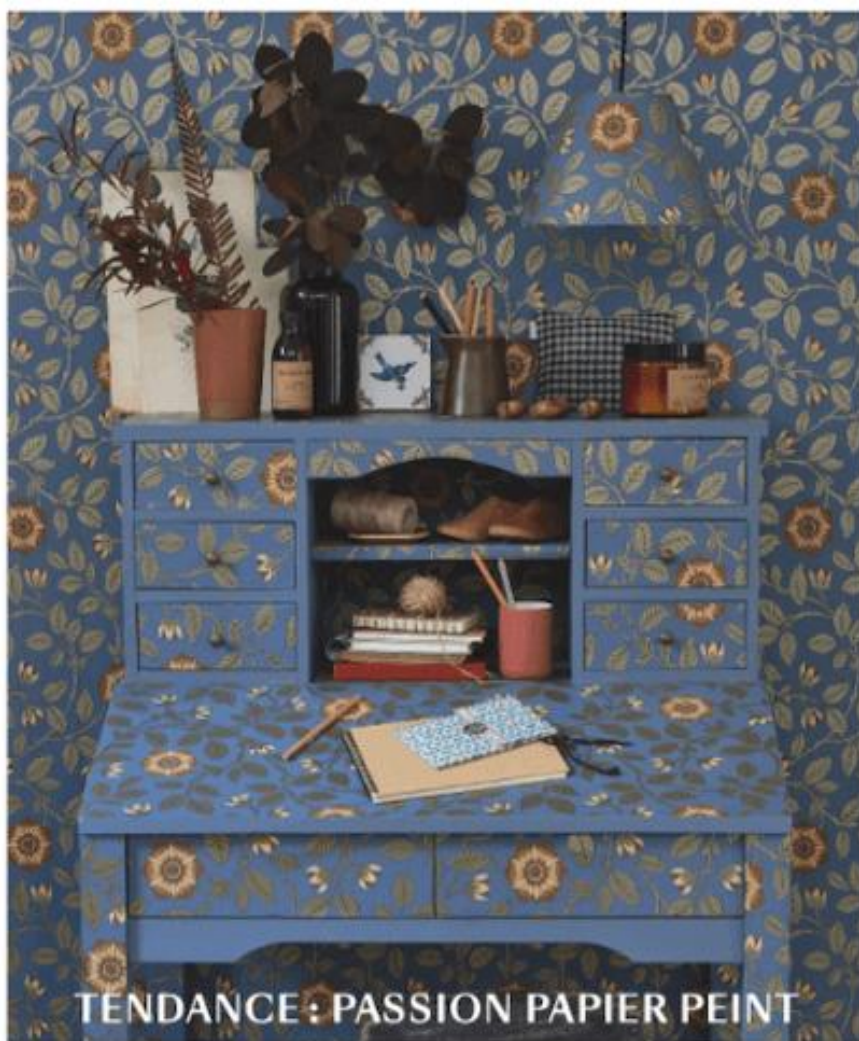
TENDANCE : PASSION PAPIER PEINT