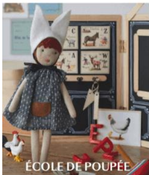
ÉCOLE DE POUPEE

C'EST PARTI POUR LA RENTRÉE! NOS SACS FÉTICHES BRODERIE ET TRICOT D'AUTOMNE ATELIER D'ARTISTE